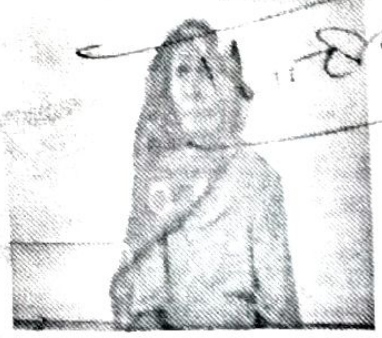
पट्टा देने वाला